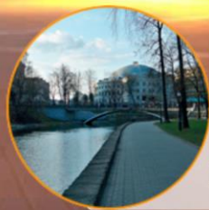
НАЦИОНАЛЬНЫЙ ЦИРК РЕСПУБЛИКИ БЕЛАРУСЬ