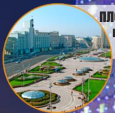
ПЛОЩАДЬ НЕЗАВИСИМОСТИ и подземный торговый центр «СТАЛИЦА»