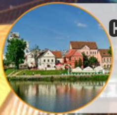
СТАРЫЙ ГОРОД и TRINITY HILL