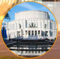
НАЦИОНАЛЬНЫЙ ТЕАТР ОПЕРЫ И БАЛЕТЫ