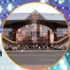
ЖЕЛЕЗНОДОРОЖНЫЙ ВОКЗАЛ и современный ТРЦ «ГАЛИЛЕО»